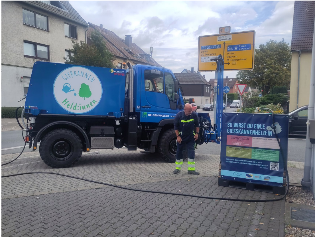
Der Unimog von Gelsenwasser als Wassertaxi